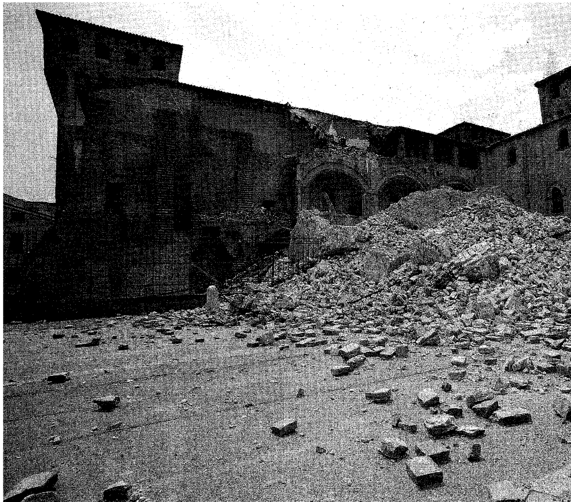
sopralluoghi continuano, ma l'incertezza e i danni stanno mettendo a dura prova gli sfollati

Si entra nella quarta settimana dopo il primo sisma che ha colpito la Bassa