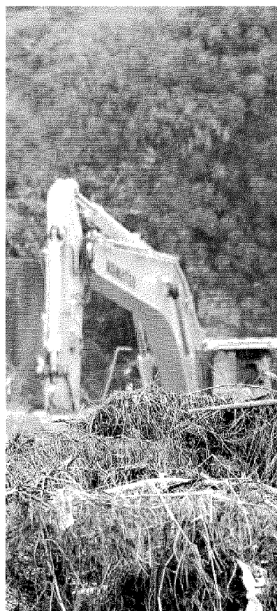
I GEOLOGI Da loro un appello alla prevenzione

Ritaglio stampa ad uso esclusivo del destinatario, non riproducibile.