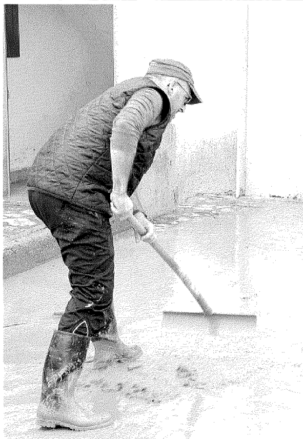
SI SPALA IL FANGO A decine scene come questa nell'area occidentale