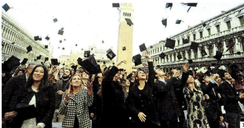
In alto, festeggiamenti di neolaureati per il diploma appena conquistato