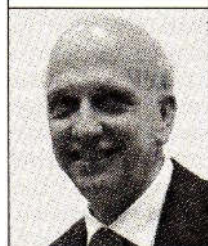
Marco Bussetti ministro dell'Istruzione