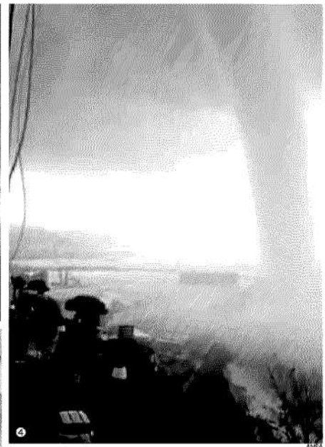
1. Il passaggio di una tromba d'aria a Imperia 2. La nube a imbuto, tipica del tornado, nei cieli del Salento la settimana passata 3. I danni causati dalla tromba d'aria che ha interessato la zona di Crotona domenica scorsa 4. La tromba marina che si è abbattuta su Salerno pochi giorni fa tratta dal frame di un video