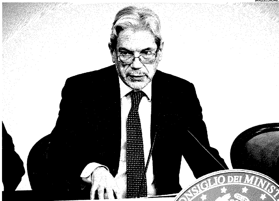
Sottosegretario alla presidenza del Consiglio. Claudio De Vincenti

In realtà parliamo di oltre 38 miliardi di euro che, attraverso le allocazioni definite ieri dal Cipe sulla base delle scelte proposte dalla cabina di regia del Fsc, vengono allocati, nel rispetto della ripartizione