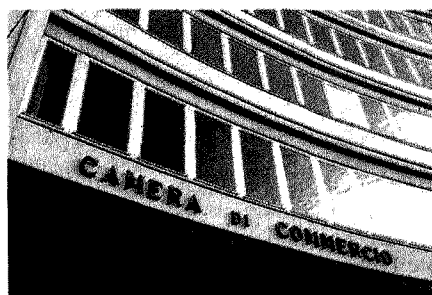
CAMERE DI COMMERCIO

Ancora aperto il confronto sul decreto di riforma della dirigenza, che introduce gli incarichi a tempo e il rischio di tagli di stipendio fino al licenziamento per chi rimane senza posto. Uno dei nodi della delega tanto che oggi ci potrebbe essere soltanto un primo via libera "salvo intese" per rivedersi il 25 agosto. La Pa sceglierà i propri dirigenti all'interno dei ruoli (Stato, regioni ed enti locali, a cui si dovrebbe affiancare un quarto per le autorità indipendenti) per affidare gli incarichi quadriennali, rinnovabili una sola volta. I nuovi dirigenti accederanno invece ai ruoli tramite un concorso o un corso-concorso