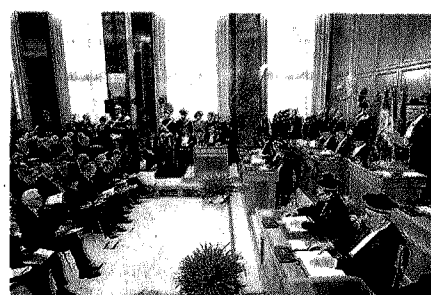
CORTE DEI CONTI

Anche il codice dell'amministrazione digitale taglia oggi il traguardo finale. Tra le novità in arrivo con il Cad c'è l'ampliamento dei diritti di cittadinanza digitale e il diritto per ogni cittadino al domicilio elettronico reso accessibile con un un pin unico collegato all'Anagrafe nazionale della popolazione residente. Scompare, inoltre, il termine del 12 agosto 2016 entro cui le amministrazioni avrebbero dovuto adottare le regole tecniche per i documenti elettronici. La norma rinvia a un futuro Dm della funzione pubblica