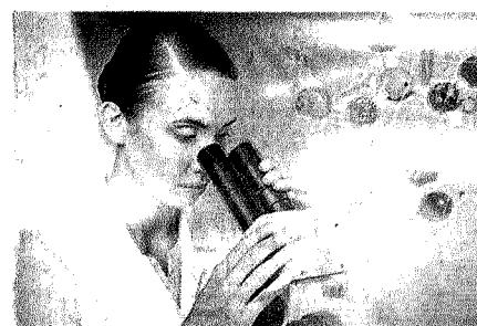
ENTI DI RICERCA

Primo approdo in Cdm per il giro di vite sulle Camere di commercio. L'orizzonte, già definito nella delega, è quello di ridurre del 40% le Camere di commercio, passando da 105 a 60 enti. Unioncamere sarà chiamata a definire entro sei mesi un piano di razionalizzazione del personale. Obbligo di alleggerimento anche per gli organismi di amministrazione, con una revisione delle tre fasce dimensionali (saranno solo due sopra o sotto le 80mila imprese) e del numero di consiglieri previsti in ogni fascia: passeranno da 3.000 a 1.600, mentre i componenti di giunta scenderanno da 1.000 a 300