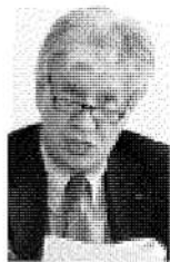
Gaetano Stella. Presidente di Confprofessioni

mente una leva che consente di restare sul mercato.