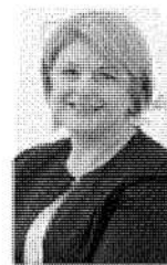
Marina Calderone. Presidente Cup e consulenti del lavoro

Per effetto della liberalizzazione delle tariffe del 2006, oggi i ceti professionali italiani sono sempre più spesso alla mercé di soggetti contrattualmente più forti, in grado di imporre clausole vessatorie. Ecco perché va considerata come