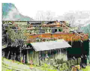
Rischio idrogeologico Sopra, gli effetti delle piogge a San Pietro in Cadore (Belluno). Sotto, i danni del vento nel Bellunese e allagamenti nella golena del Piave in provincia di Venezia