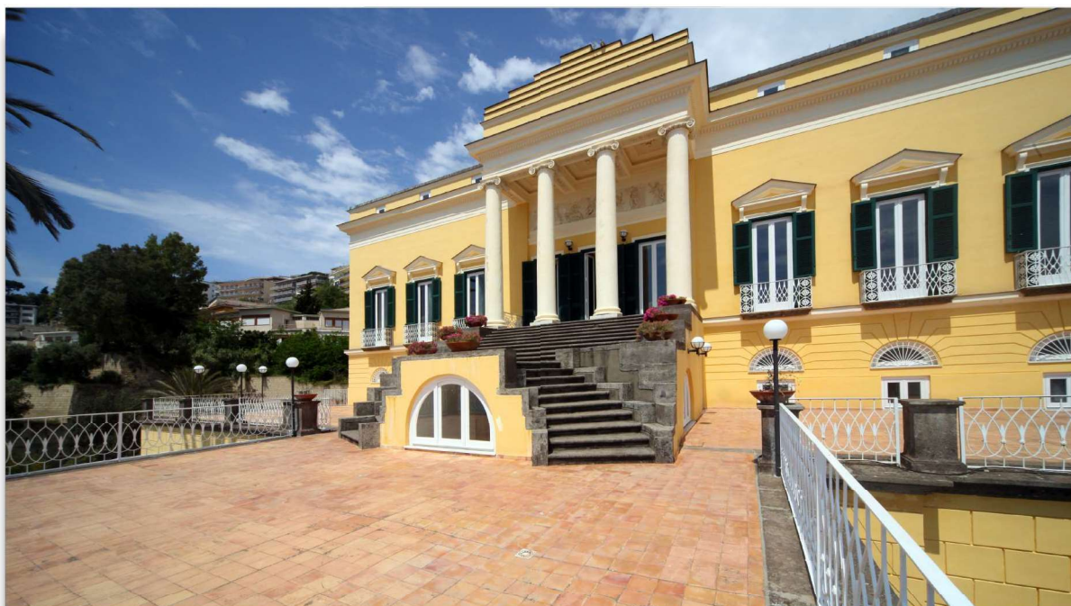
Università degli studi di Napoli Parthenope Complesso di Villa Doria D'Angri Via Petrarca 80, Napoli

Per partecipare scansiona il QR code o accedi al seguente link: